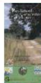
Wandelkaarten Attert, Arlon, Martelange