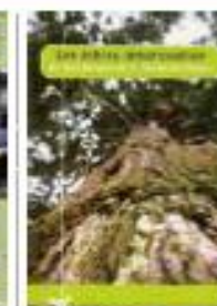
Uitzonderlijke bomen Deze gratis folder (In het Frans) is uitgegeven door Regionaal Landschap Attertvallei. Eveneens te verkrijgen in het Bezoekerscentrum. www.aupaysdelattert.be/envir.php