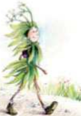
Illustration: Valérie Dées

De wandeling werd getest door een personeelslid van Streektoerisme Aarlen in november 2011. Een wandelkaart is te koop in de DVT aan 7.50€